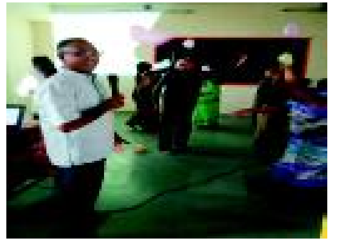
‘આપણી મા’ -ઓક્ટોબર-૨૦૧૯ થી ડિસેમ્બર-૨૦૧૯ (૨૨)

ત્યારબાદ બરાબર ૧-૦૦ વાગ્યે જમવા ગયા. પ્રાર્થના રેવ ફાધર દ્વારા. સમય કાર્યક્રમ ૨-૩૦ કલાકે પૂર્ણ. વડિલોના ચહેરા ઉપર અનેરો આનંદ જોવા મળ્યો. કાર્યક્રમ પાછળ મોટો ખર્ચ રેવ ફાધર લોરેન્સ દ્વારા કરવામાં આવ્યો.